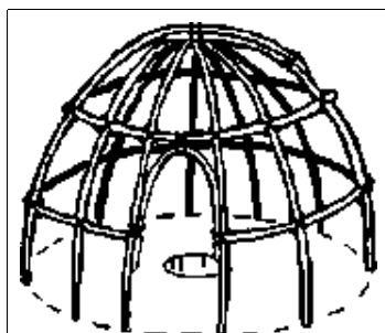
Obr 2: Proutěná kostra větší sweatlodge z deseti svislých prutů a s vykopanou jámou na žhavé kameny

Podobně, jako existuje více typů potní chýše, existuje i více způsobů uspořádání jejího okolí. Někdy cestička směřuje přímo na východ a je zakončena zmíněným oltářem, jindy